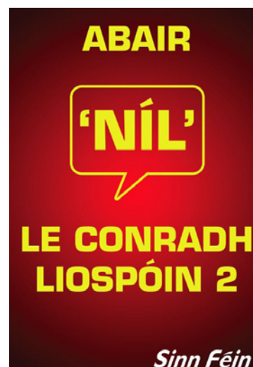
MANIFESTO IN GAELICO: DÌ NO AL TRATTATO DI LISBONA