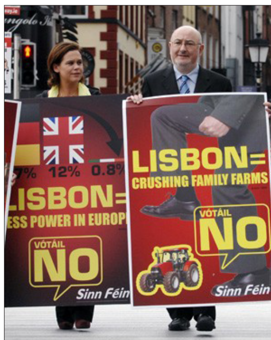
Mary-Lou McDonald durante una manifestazione per il no.

di marca Euro fossero pronti al peggio: “Qualsiasi cosa accada, l’Europa deve avanzare perché non ha scelta” aveva annunciato Pierre Lellouche, ministro per gli affari europei di Sarkozy. A fronte di una crisi economica già durissima e con prospettive anche peggiori: l’annuncio del taglio di ulteriori 17.000 posti di lavoro statali nonostante la disoccupazione sia al 12% e entro fine anno salirà al 16%; taglio dell’8% delle spese di istruzione con la chiusura di decine e decine di scuole rurali e 6.900 insegnanti sul lastrico; per non parlare del taglio di un ulteriore 5% delle spese sociali. È ripresa, anche in Irlanda, l’emigrazione, unica soluzione negli anni della fame nera nell’isola. Arriva, anzitempo Babbo Natale: la Banca Centrale Europea (BCE) – sempre tiratissima – immette 120 miliardi di Euro nel sistema bancario irlandese (il 15% dei prestiti totali) e la Commissione europea regala una mancia di 17 milioni di € per aiutare i licenziati. La democrazia vale un tot al chilo e solo se è funzionale agli interessi delle multinazionali, le “vecchie” costituzioni non lo sono più, ecco uscire dal cilindro il trattato di Lisbona, il quale rimette in riga l’apparato giuridico politico dell’attuale fase del capitalismo europeo.