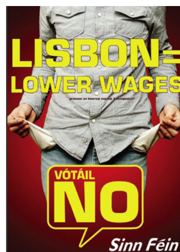
LISBONA = MENO SALARI

dalla maggioranza. Ovvero il Parlamento francese non rappresenta il popolo. Anche il Commissario irlandese Charlie McCreevy è stato chiarissimo al proposito: “il Trattato di Lisbona sarebbe rigettato dal 95% dei Paesi europei se fosse loro concesso un referendum”. Lo stesso ha fatto il governo olandese, meglio mettere a riparo dal voto popolare la codificazione degli interessi delle multinazionali di origine europea. Insomma se i cittadini si oppongono con il voto ad una legge, devono rivotare finché non sono d’accordo. Lo stesso è successo in Irlanda. In quel paese il referendum sugli accordi internazionali è legge; quindi bisogna votare. Lo scorso anno il popolo irlandese ha detto NO al Trattato di Lisbona. Il popolo, per il grande capitale europeo, ha sbagliato, quindi deve tornare al voto poiché non è ammissibile che le masse si oppongano ai suoi disegni. Dunque anche in Irlanda si deve tornare a votare, a danno del concetto di democrazia foss’anche quella borghese. Del resto già nel 2001 gli irlandesi bocciarono una prima volta il Trattato di Nizza per poi essere obbligati a tornare a voto per adottarlo. Ovviamente se avesse vinto il SÌ gli irlandesi sarebbero stati chiamati alle urne. “Non