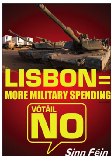
LISBONA = PIÙ SPESE MILITARI

rafforzando i poteri del Parlamento in materia di designazione e controllo della Commissione, nonché ampliando gradualmente il campo di applicazione della procedura di codecisione. Ma si tratta solo di apparenza in un sistema che, figlio del Capitale, ha dentro di sé la sua contraddizione. Intanto nel modo con il quale si è percorso il cammino dell’integrazione del capitale europeo nelle sue forme di rappresentanza e camere di compensazione delle contraddizioni tra i