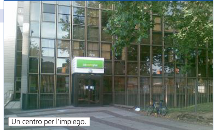
Un centro per l'impiego.

Di fronte ad un contesto generale così preoccupante, risalta in tutta la sua drammaticità la specifica condizione dei più giovani. Secondo quanto dichiarato da Angela Eagle, Ministro per il Lavoro e la Previdenza, e Theresa May, sua omologa nel governo ombra, di particolare gravità è la situazione occupazionale della fascia di forza lavoro compresa tra i 16 ed i 25 anni. In base alle statistiche disponibili, infatti, 928.000 cittadini al di sotto dei 25 anni risultavano senza impiego in giugno, con una perdita di ulteriori 300.000 posti solamente nell'ultimo anno. Allarmante è anche il dato relativo alla forza lavoro qualificata: l'8% tra coloro che posseggono un titolo universitario sono attualmente senza un impiego, tasso che sale al 10% tra i laureati in Architettura,