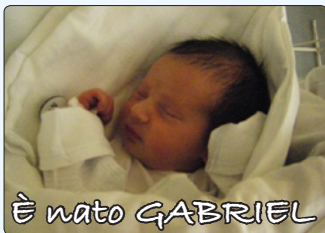
È nato GABRIEL

Purtroppo, però, il razzismo sembra albergare non solo nei fanatici fascisti della Lega Nord e affini. Il prode Napolitano, ormai sempre più succube e tappettino di Berlusconi, rispetto agli emigrati italiani all'estero, non risponde. Gli abbiamo scritto in merito alla violazione di nostri diritti costituzionalmente sanciti, ancora attendiamo risposta. Sembra che per un aristocratico come Napolitano sia facile proferire le parole belle della democrazia e dell'uguaglianza; nei fatti però noi emigrati, anche a lui, diamo fastidio, puzziamo.