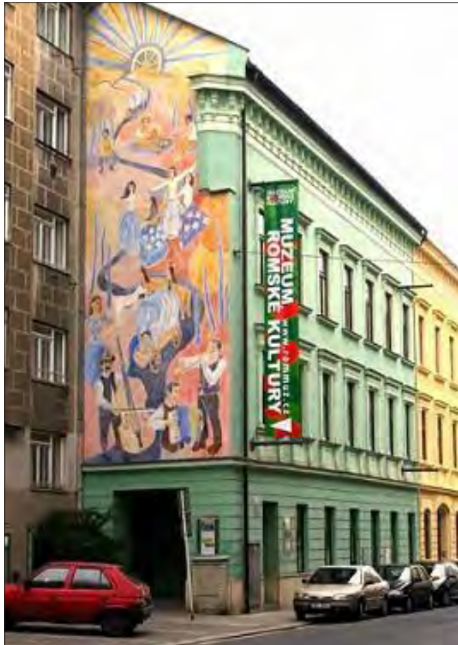
Il Museo della Cultura Rom a Brno.

Troppe volte nella storia – purtroppo – è stato difficile stabilire quale fosse la fluttuante linea di demarcazione che divideva la xenofobia dal diritto alla sicurezza. Sulla sicurezza si sono sempre fatte battaglie di classe. La sicurezza è sempre stato il pretesto con le quali le classi più abbienti invocavano un “giro di vite” per difendere i loro privilegi dall’insidia di turno, presentandosi sotto forma di classe contadina, operaia, di lavoratori stranieri, immigrati clandestini, minoranze etniche o di altro tipo. L’esempio più recente in Italia la campagna elettorale per le politiche dello scorso anno, scientificamente “spostata” sulla sicurezza (anche perché di situazione economica, diritti e giustizia sociale ecc., cosa ci avrebbero potuto raccontare?) dalla destra xenofobo-leghista che ha convinto anche settori – ahinoi – di classe operaia.